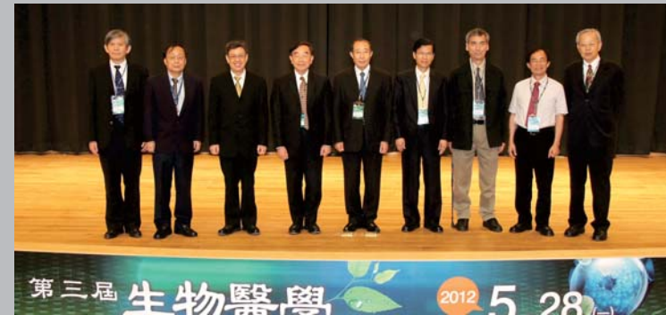
101年5月28日舉辦第三屆生物醫學新知研討會 中研院院士多人與會共襄盛舉